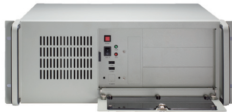
▲ Front view