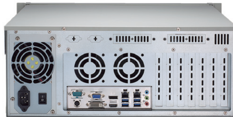
▲ Rear view